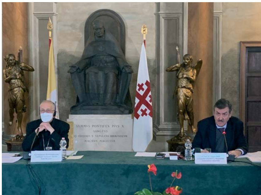
Il Gran Maestro e il Governatore Generale dell'Ordine, in occasione della riunione di primavera del Gran Magistero, lo scorso 15 aprile.