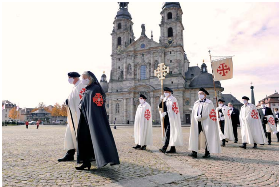
Processione in occasione della celebrazione d'investitura a Fulda, a Settembre 2020.

ganizzati pellegrinaggi in zone limitrofe e processioni nel rispetto delle dovute distanze; ci si è riuniti nei giardini dei confratelli e consorelle dell'Ordine, celebrando messe all'aperto; sono stati programmati concerti di organo e ha avuto luogo la prima escursione familiare adattata alla situazione sanitaria; le riunioni sono state spostate in chiese dove non si celebravano soltanto messe, ma si as-