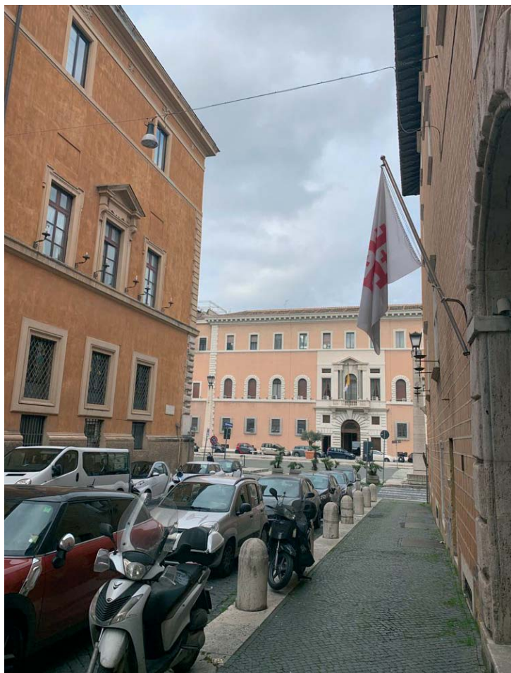
La Via dei Cavalieri del Santo Sepolcro, perpendicolare a Via della Conciliazione che porta a Piazza San Pietro, costeggia il Palazzo della Rovere a Roma, sede internazionale dell'Ordine.

Lo storico palazzo rinascimentale edificato dal Cardinale Domenico della Rovere, nella fine del 1400, aveva sempre dato alle vie adiacenti il nome dell'inquilino che lo abitava. Dal Cardinal Luigi Aragona, che lo abitò dal 1513, ricevendovi personaggi del tempo quali il Duca di Ferrara e Isabella d'Este, la piazza antistante prese nome per qualche anno di Piazza d'Aragona. Dal Cardinal Salviati che abitò il palazzo dal 1526 al 1533, la piazza predetta prese il nome di Piazza Salviati. Quando vi prese dimora il celebre Cardinal Mandruzzo, Vescovo di Trento, che tanta parte ebbe nell'avviare la Controriforma nel Concilio tenutosi in quella città, la piazza in questione si chiamò Piazza di Trento. Infine quando il Palazzo divenne la sede del Collegio dei Penitenzieri la via adiacente