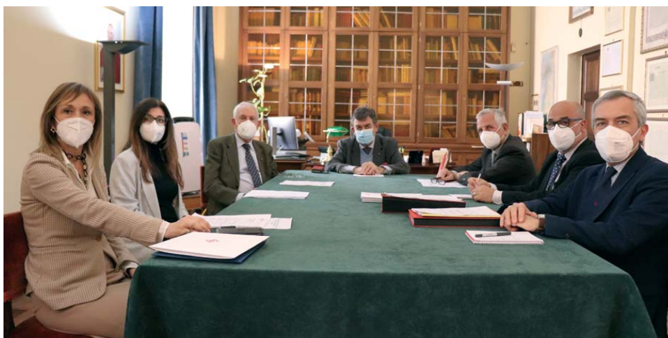
L'ufficio amministrativo del Gran Magistero durante una delle recenti riunioni di lavoro, insieme al Governatore Generale dell'Ordine, Leonardo Visconti di Modrone.

rienza diversa, quella maturata in oltre quarant'anni di vita diplomatica e nella pubblica amministrazione. Desidero poi ringraziare i due Gran Maestri, con cui ho avuto il privilegio di lavorare, per la fiducia e la benevolenza dimostratami. Senza il loro sostegno non avrei mai potuto svolgere il compito affidatomi. Infine debbo rendere merito al personale che mi assiste – che non è numeroso, ma è estremamente qualificato – per una efficiente assistenza ed una costante dedizione. Mi sono sovente interrogato sui motivi per cui ero stato chiamato a quell'incarico e prescelto fra tanti confratelli con maggiore anzianità nell'Ordine. La risposta che